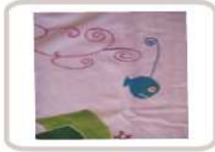
Colcha pintada a mano, para surcar los mares y luchar con los tiburones de plata, voladores en sueños.