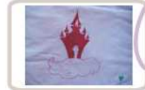
Colcha para "ratitas presumidas" que pasan el día jugando con lápices de colores y mucha imaginación.