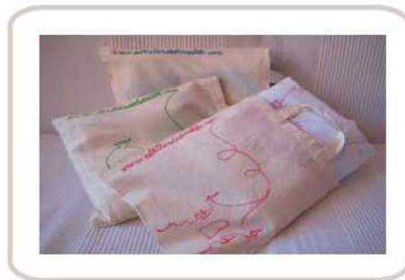
Para que puedas llevar las colchas-cambiador donde tú quieras, una práctica bolsa a juego.