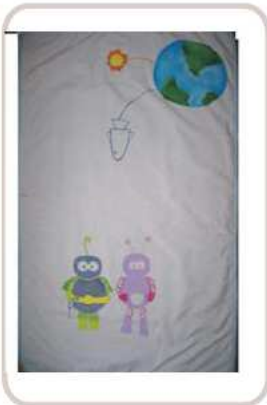
Colcha pintada a mano, para minicuna o moises. Colcha para aventureros espaciales, para soñar con las estrellas.